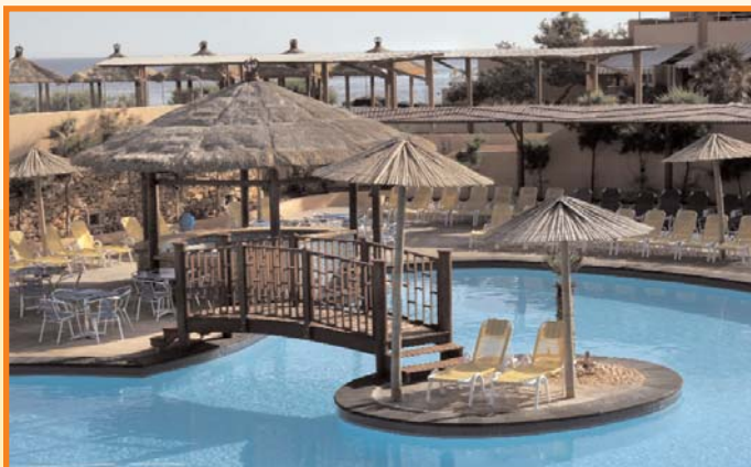
Ramla Bay Resort 4* Меллиха МАЛЬТА

Отель расположен на самом севере Мальты, на берегу уединенного полуострова с видом на о. Гозо и о. Комино. Рекомендован для семейного отдыха с детьми, а также для любителей спокойной и размеренной атмосферы. Недалеко от отеля есть автобусная остановка. Отель полностью обновлен в 2006 г.